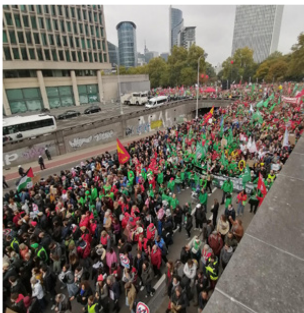
MANIFESTATION NATIONALE, BRUXELLES 14 octobre 2025

Autre élément de la réforme : la limitation du droit au salaire garanti en cas de rechute. Ce n'est qu'après huit semaines (au lieu de deux) que le·la travailleur·euse pourra à nouveau bénéficier de trente jours de salaire garanti. Quant à ceux qui reprennent le travail partiellement, iels n'y auront tout simplement plus droit.