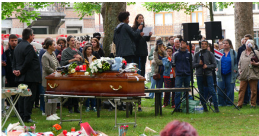
HOMMAGE À FABIAN, BRUXELLES 5 juin 2025