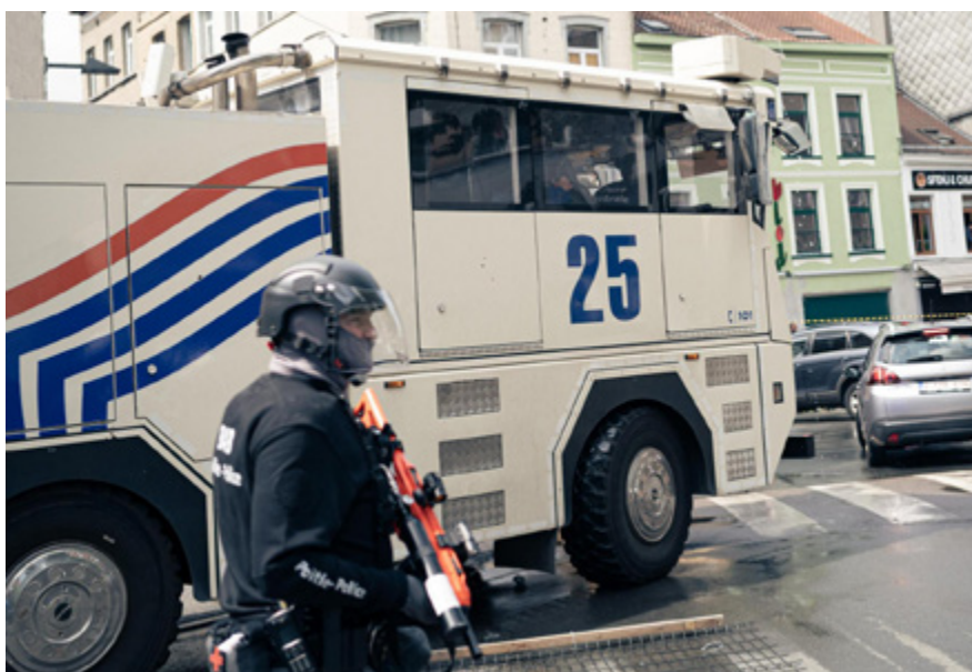
POLICIER ARMÉ D'UN FN 303 EN MARGE DE LA MARCHÉ BLANCHE EN HOMMAGE À FABIAN, BRUXELLES 8 juin 2025

Ces ordonnances de police restreignant l'occupation de l'espace public ont vu le jour dans d'autres communes. À Schaerbeek, suite à des incidents de violences graves et des troubles à l'ordre public, une décision communale « interdit, 24h/24h, de se réunir à plus de cinq personnes à la fois sur l'espace public » dans un périmètre du quartier Marbotin pendant trois mois. En cas de non-respect, l'amende pourra s'élever à 500 euros, par personne.