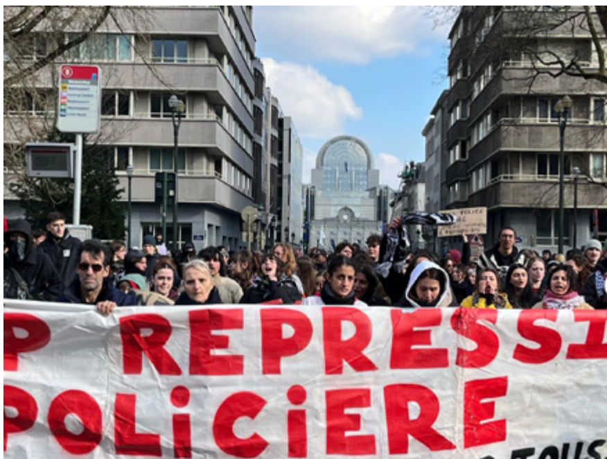
MANIFESTATION CONTRE LES VIOLENCES POLICIÈRES, BRUXELLES mars 2025

Dans ces circonstances, il est à craindre que les policier·ères continuent de mettre en danger des citoyen·nes qui circulent dans l'espace public, et de poursuivre des personnes à tout prix, même celui de leur vie.