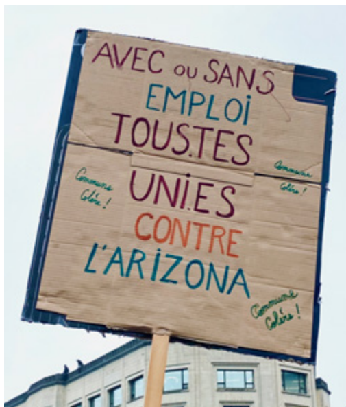
MARCHE CONTRE LES EXCLUSIONS DU CHÔMAGE, BRUXELLES 24 avril 2025

Face à l'ampleur des exclusions prévues, la LDH a introduit, avec les syndicats et plusieurs associations, un recours contre la mesure , considérant qu'elle contrevient au droit à la sécurité sociale et fragilise de manière disproportionnée les personnes les plus précaires.