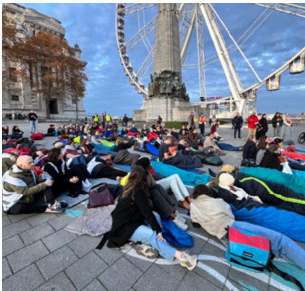
« PAS UN ENFANT DANS LA RUE », ACTION DE PLUSIEURS ONG CONTRE LA LOI ACCUEIL, BRUXELLES 13 novembre 2025

Ces mesures visent en réalité à arrêter et détenir ces personnes afin de les forcer à quitter le territoire. Ce projet, jugé disproportionné, suscite de nombreuses critiques et viole certains droits fondamentaux comme le droit au respect de la vie privée et familiale.