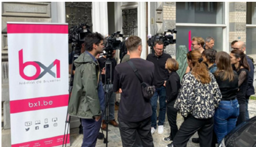
GRÈVE DU PERSONNEL DE BX1 EN RAISON DE LA DÉGRADATION DE SES CONDITIONS DE TRAVAIL, BRUXELLES 8 juillet 2025

En juillet, le contrat de gestion de la RTBF était modifié à l'initiative de la ministre des Médias Jacqueline Galant (MR). « La RTBF n'a pas vocation à devenir le centre de gravité de l'audiovisuel belge francophone », avait-elle déclaré. Près de 133 millions devront être économisés d'ici 2028. Plusieurs programmes ont déjà été rayés de la carte, notamment des collaborations avec les médias de proximité et des émissions culturelles.