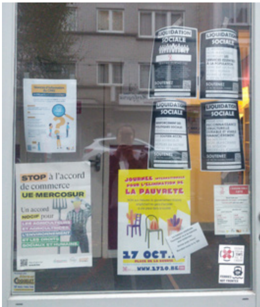
CAMPAGNE « LIQUIDATION SOCIALE » DE LA FÉDÉRATION DES SERVICES SOCIAUX, BRUXELLES 17 octobre 2025

Résultats ? Des associations actives dans la santé mentale, dans la lutte contre les addictions, la pauvreté ou l'accueil des réfugié-es, etc., vivent « à la petite semaine » : des projets gelés, à l'arrêt, des emplois menacés... Et des services rabotés, alors que les besoins dans la capitale explosent et que les réformes de l'Arizona risquent bien de dégrader plus encore cette situation sanitaire et sociale.