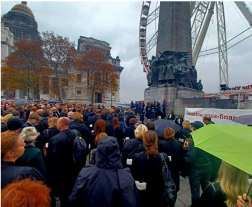
MOBILISATION DES ACTEUR·RICES DE LA JUSTICE, BRUXELLES, 14 novembre 2025

D'une affaire à l'autre, les juges devront analyser des dossiers parfois complexes en vue de répondre à des questions tout sauf simples : est-il absolument nécessaire de maintenir cette personne préventivement en prison ? Est-il opportun de maintenir une saisie sur une part importante du patrimoine d'une autre ? Cette instruction judiciaire a-t-elle été menée de manière régulière ?