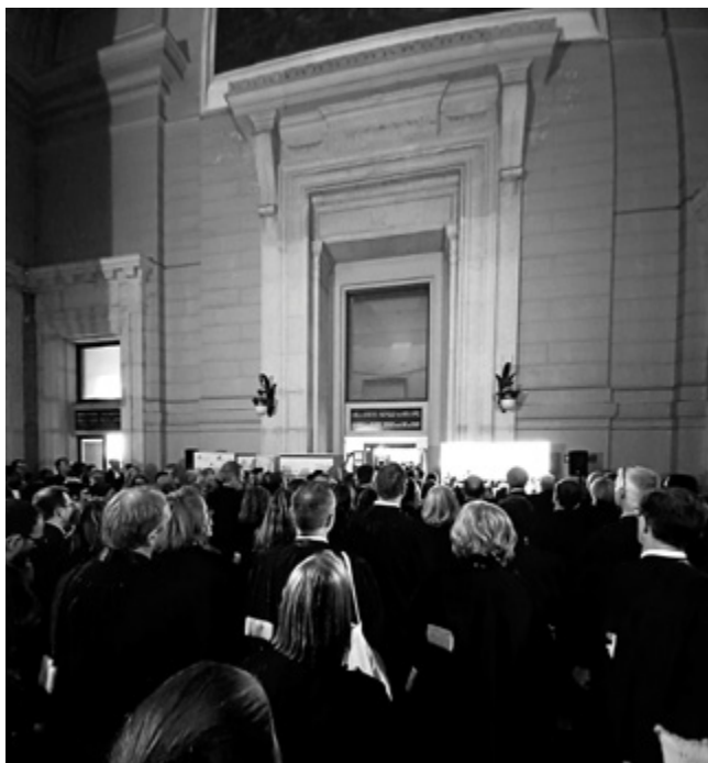
DÉCLARATION DES PLUS HAUTS MAGISTRATS DU PAYS AU PALAIS DE JUSTICE, BRUXELLES 27 juin 2025

Il est stupéfiant de constater que le sous-financement de la Justice paraît avoir été accepté par le corps social, comme une réalité regrettable mais immuable. Pourtant, il détruit notre société, de façon peut-être plus diffuse et moins visible que les mouvements fascistes, racistes et autoritaires, mais il la détruit aussi.