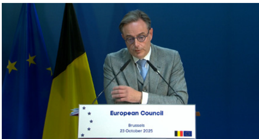
BART DE WEVER AU CONSEIL EUROPÉEN, BRUXELLES 23 octobre 2025

En clair, c'est renverser le paradigme fondateur de tout État démocratique, à savoir que le respect des droits humains doit être le principe, ses limitations devant rester des exceptions. Ce que proposent ici nos élites politiques, ce n'est rien moins que d'exclure certains individus de la protection de la CEDH en raison de leur nationalité. On rétorquera qu'il s'agit là d'un public bien particulier, puisque cumulant séjour illégal et condamnation pénale. Certes. Mais le fondement de la protection des droits humains repose justement sur le fait que les êtres humains bénéficient de la protection des droits fondamentaux car ils et elles sont des êtres humains et qu'il n'est en aucun cas question d'en exclure une partie de l'humanité, quelles qu'en soient les raisons. Remettre en question