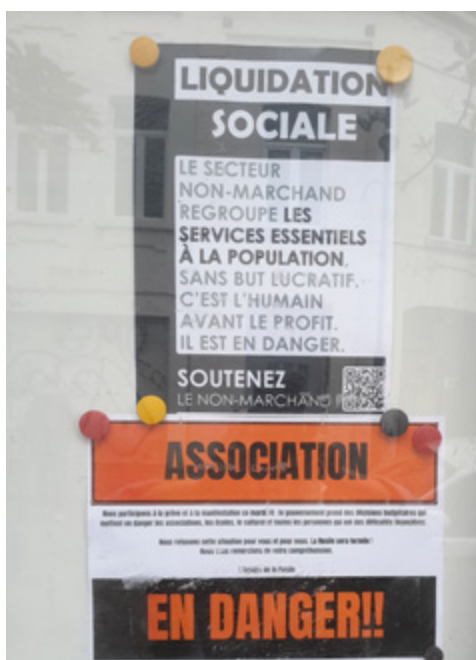
CAMPAGNE « LIQUIDATION SOCIALE » DE LA FÉDÉRATION DES SERVICES SOCIAUX, BRUXELLES 10 octobre 2025

compromis dégagé avait des airs de chantage. Parmi les organisations qui allaient perdre leurs subventions en raison d'avis négatifs de la commission chargée d'examiner les dossiers, une poignée était issue du mouvement populaire flamand. Haro de la N-VA qui a obtenu en échange la tête de plusieurs associations dites « de gauche » qui avaient pourtant reçu un avis positif de cette même commission. L'argument invoqué pour couper leurs fonds ? Leur lien avec « l'extrémisme violent ou son soutien » selon la ministre flamande de la Culture ou parce que ces associations « ne s'en distancient pas clairement ». Il faut y lire en filigrane le soutien de ces associations aux actions menées par Code Rouge, une organisation pacifiste utilisant le levier de la désobéissance civile.