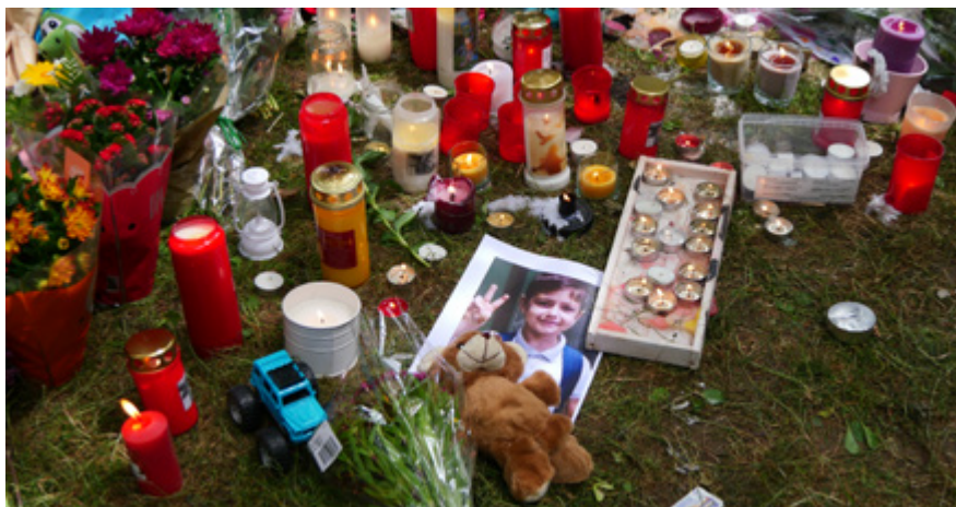
HOMMAGE À FABIAN, BRUXELLES 5 juin 2025

Selon la Cour européenne des droits de l'homme, cet usage de la force doit être absolument nécessaire. L'article 37 de la loi sur la fonction de police prévoit également que tout usage de la force doit être légitime, nécessaire et proportionné.